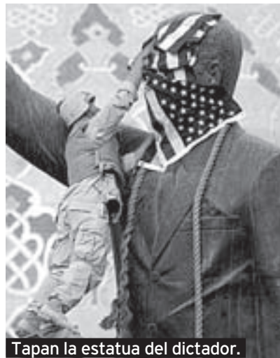
Tapan la estatua del dictador.

► 14 de abril de 2003: las tropas de EE UU entran en Tikrit, último bastión de Saddam. Los 'marines' comienzan a patrullar Bagdad y a detener a los saqueadores de la