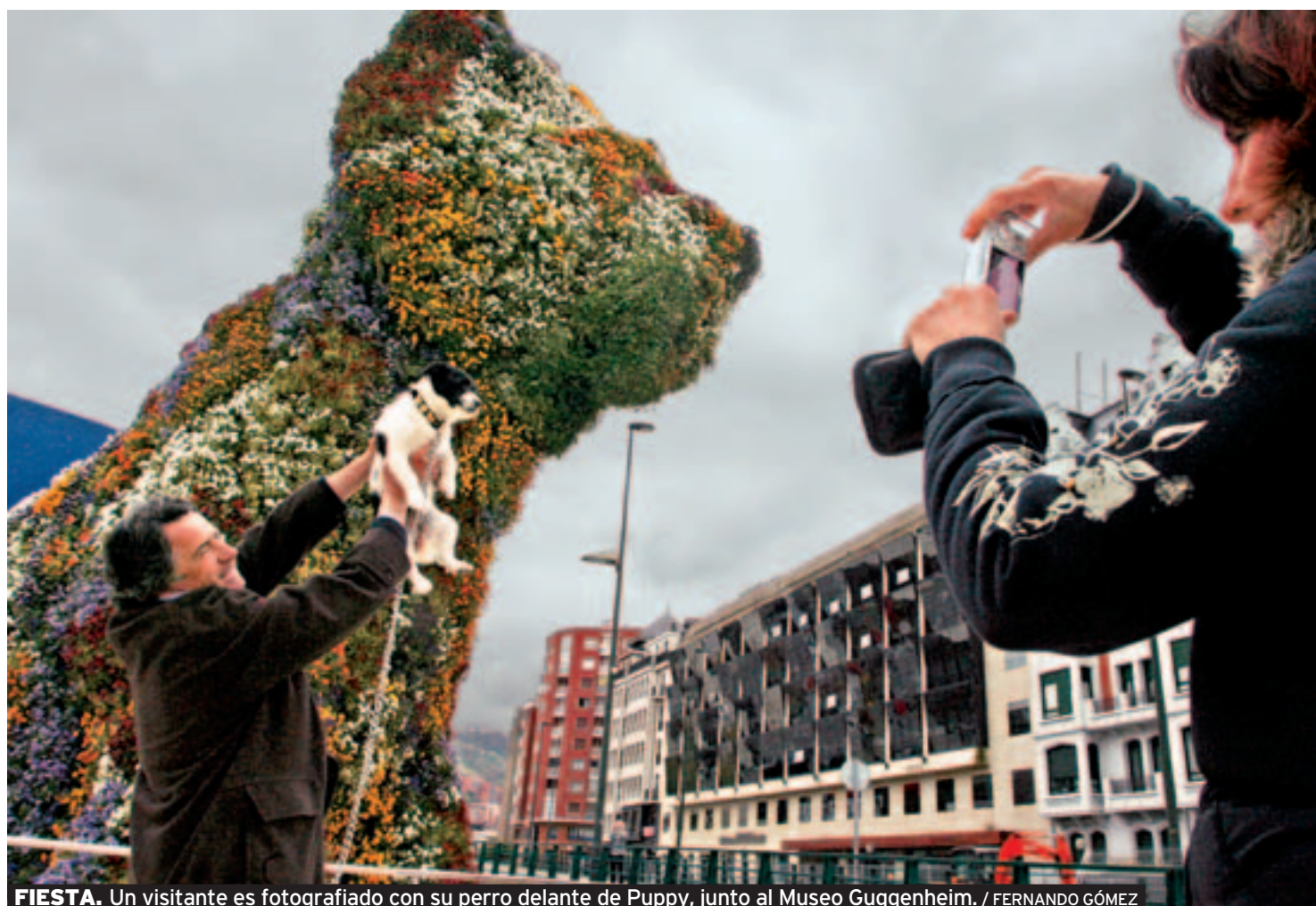
FIESTA. Un visitante es fotografiado con su perro delante de Puppy, junto al Museo Guggenheim.

El Gobierno autónomo anuncia que todos los centros deberán ofrecer la asignatura