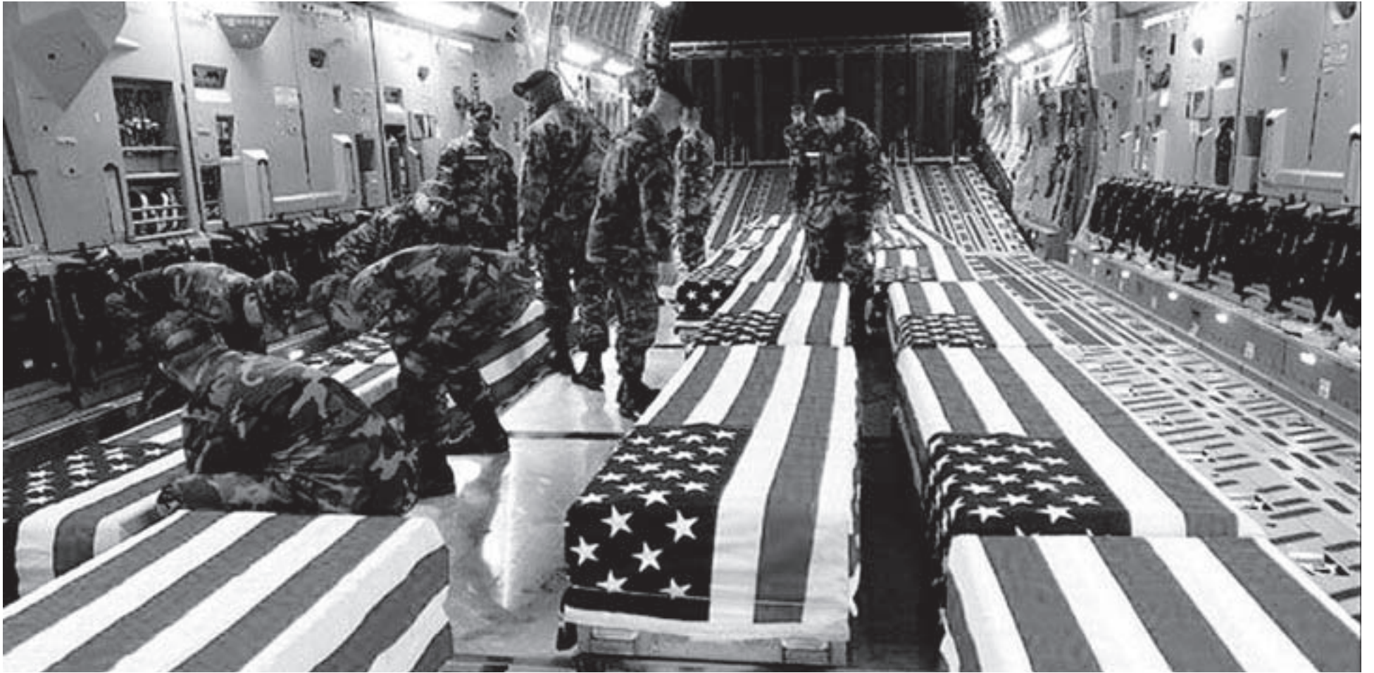
REPATRIACIÓN DE CADÁVERES. Soldados estadounidenses cubren con banderas los ataúdes de sus compañeros muertos en Irak, a su llegada a Denver.