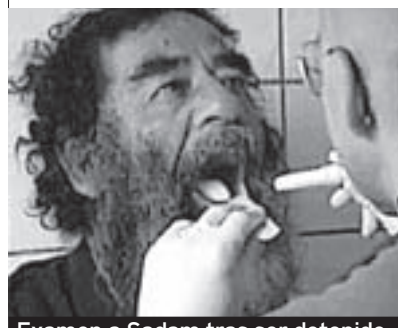
Examen a Sadam tras ser detenido.

► 28 de febrero de 2005. El ataque más cruento: la localidad de Hilla es escenario del atentado más