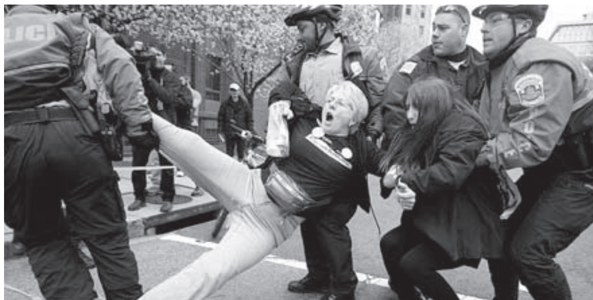
PROTESTAS. La Policía disuelve una manifestación contra la guerra en Washington.

«Todo lo que habéis hecho ha sido sin derecho y de conformidad con vuestro aliado opresor que está apunto de salir de la Casa Blanca», dice en alusión a Bush la voz del vídeo, mientras en pantalla aparece una imagen estática de Bin Laden vestido de blanco y con una metralleta, y una bandera de la UE que termina desintegrada.