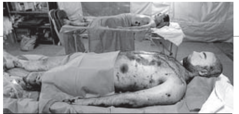
Cadáveres de los hijos de Saddam muertos en un enfrentamiento.

atacada: la sede de Naciones Unidas en Bagdad es blanco de un atroz atentado, que termina con la vida de diecisiete personas, entre ellas la del enviado especial de Kofi Annan, Sergio Vieira de Mello.